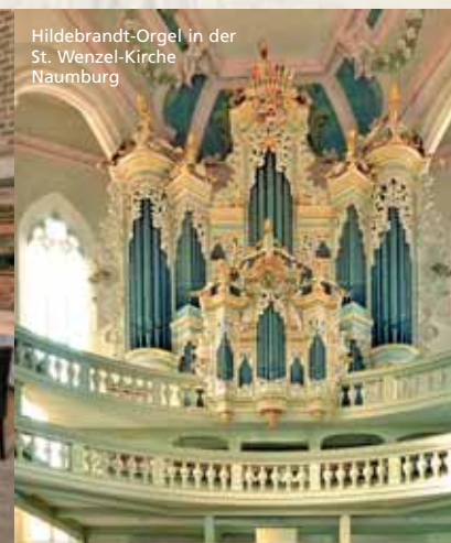
Hildebrandt-Orgel in der St. Wenzel-Kirche Naumburg