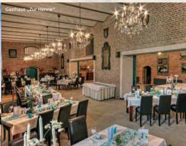
Gasthaus „Zur Henne“