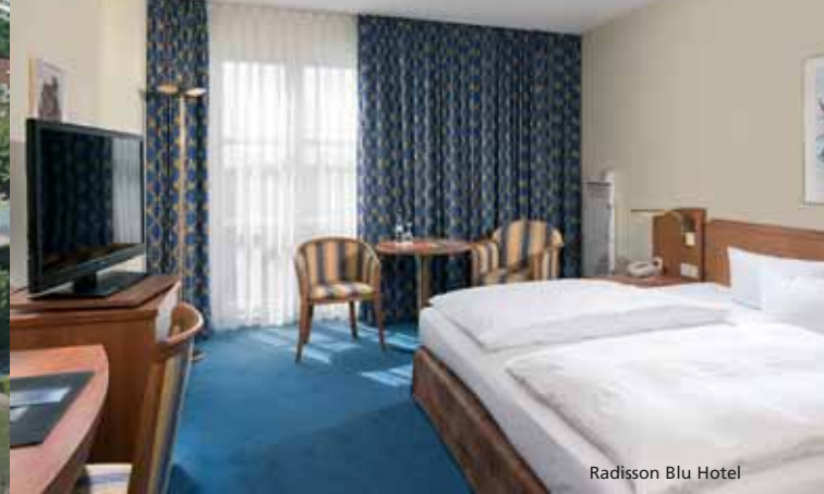
Radisson Blu Hotel