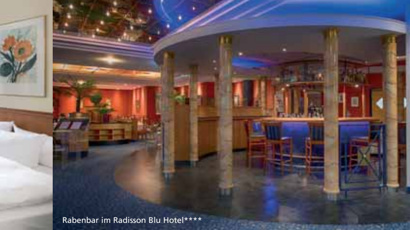
Rabenbar im Radisson Blu Hotel****