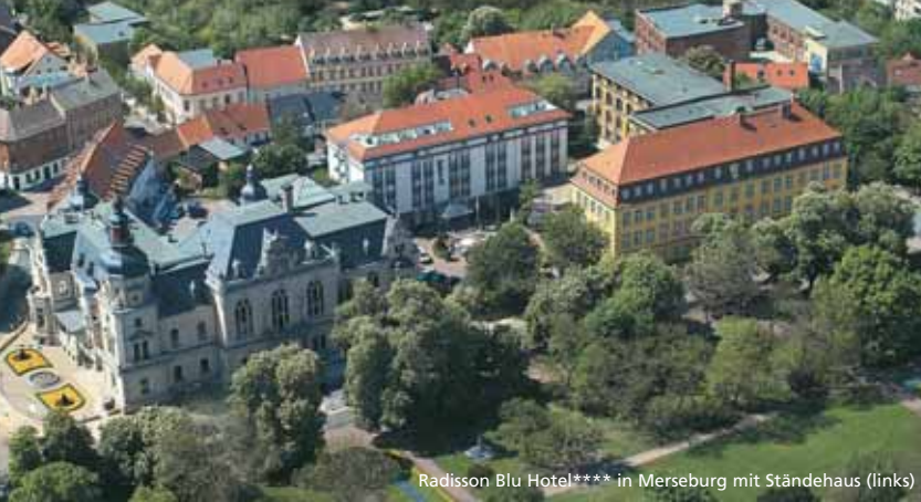
Radisson Blu Hotel**** in Merseburg mit Ständehaus (links)