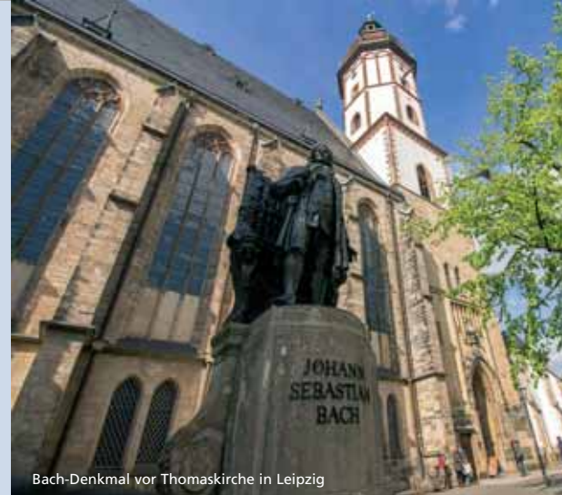
Bach-Denkmal vor Thomaskirche in Leipzig

Wir empfehlen den Abschluss einer Reiserücktrittskostenversicherung mit Covid-Schutz. Das REISEBÜRO TIMMERMANN berät Sie gerne.