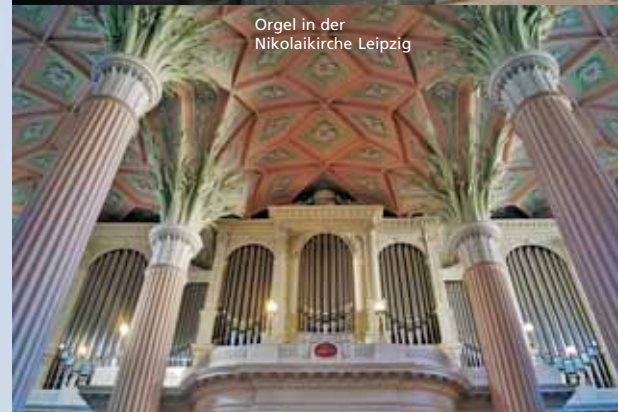
Orgel in der Nikolaikirche Leipzig