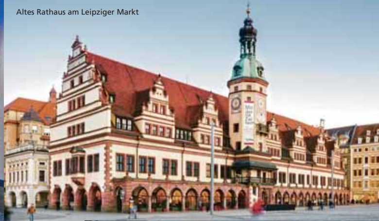
Altes Rathaus am Leipziger Markt